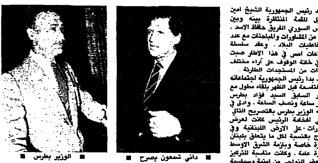
داني شمعون يصرح

مهد رئيس الجمهورية الشيع امين الجميل للقمة المنتظرة بينه وبين الرئيس السوري الفریق حافظ الاسد، بمزيد من المشاورات والمباحثات مع عدد من فاعليات البلاد. وعقد سلسلة اجتماعات امس في هذا الاطار صبت عليها في خفة الوفوف على اراء مختلف القيادات من المستجدين المطرنة.